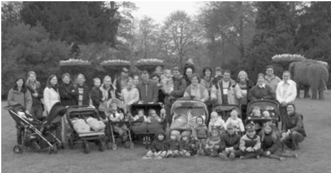
Tweelingmeeting in Planckendael