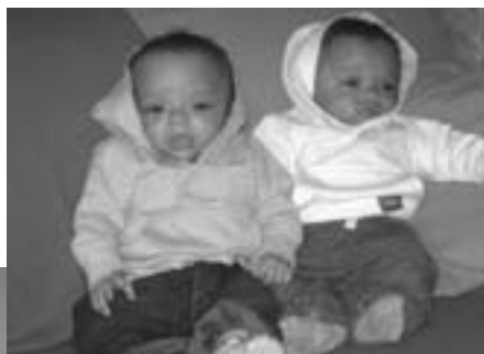
Issa en Lino