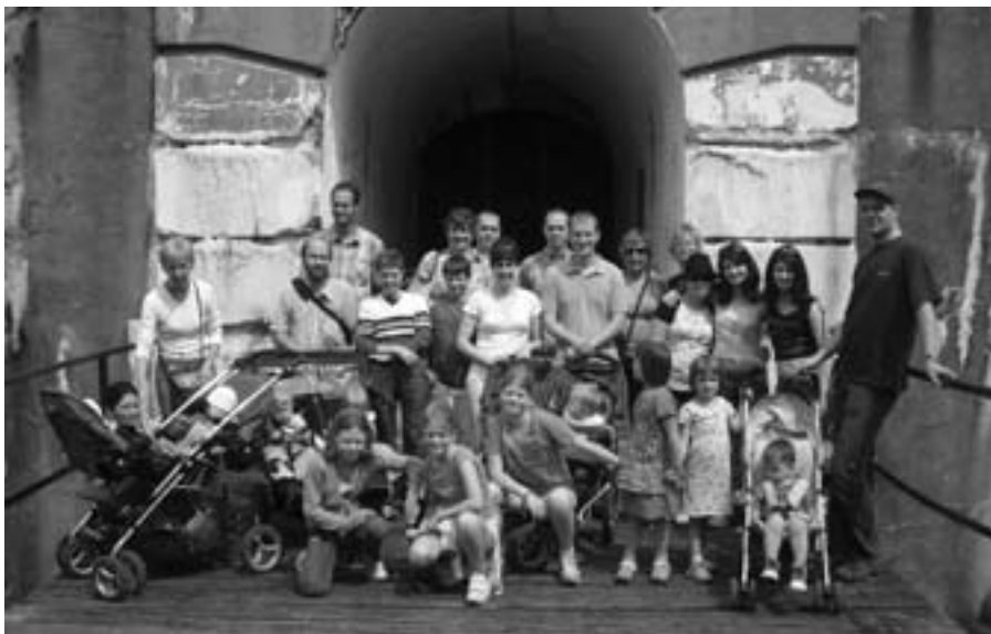
Wandeldag Twins Antwerpen te Oelegem